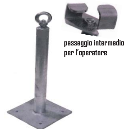
passaggio intermedio per l'operatore